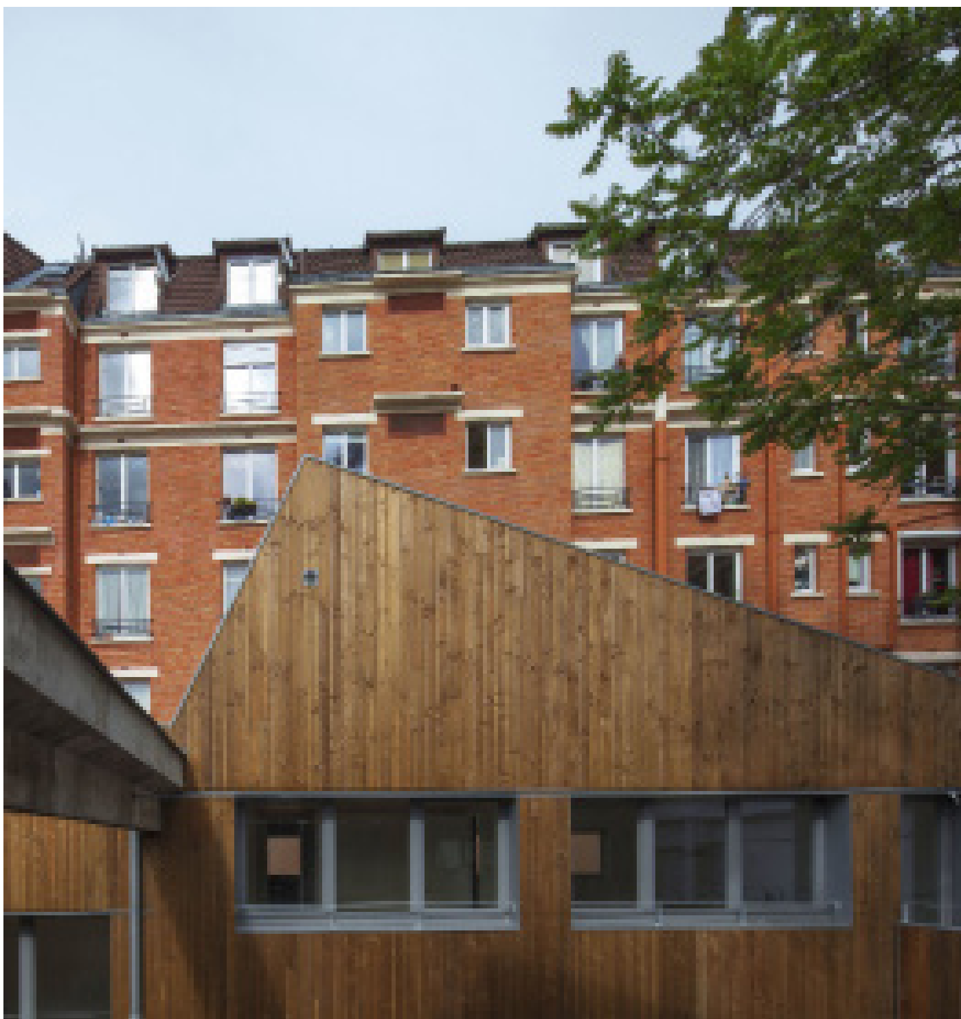
Melrose Sheds, Pantin (93), 2013 - Des Clics et des Calques architectes